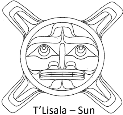
T'Lisala – Sun

The exhibition Reach for the Sky: Tradition + Inspiration features some sculptures with traditional figures of Northwest Coast art. You can try out your carving skills at home by carving your own figure on a bar of soap.