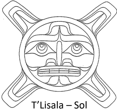
T' Lisala – Sol

La exhibición Alcanzando el cielo: Tradición + inspiración presenta algunas esculturas con figuras tradicionales del arte de la costa noroeste. Puedes probar tus destrezas de talla en casa, tallando tu propia figura en un jabón.