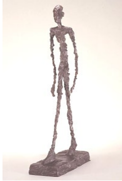
Alberto Giacometti Walking Man II , (1948) Bronze Hirshhorn Museum and Sculpture Garden, Smithsonian Institution, Washington, DC, Gift of Joseph H. Hirshhorn, 1966