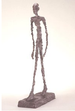
Alberto Giacometti Walking Man II , (1948) Bronze Hirshhorn Museum and Sculpture Garden, Smithsonian Institution, Washington, DC, Donación de Joseph H. Hirshhorn, 1966